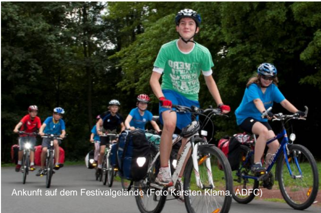
Ankunft auf dem Festivalgelände

Rund 200 fahrradbegeisterte Jugendliche treffen sich aus ganz Deutschland zum JugendFahrradFestival, kurz jufafe, das alle 2 Jahre vom ADFC veranstaltet wird. Drei Tage Spaß und gute Stimmung bei coolen Workshops und Aktionen rund ums Rad erwartet Dich in Hamburg. Das Festival findet in der DJH Horner Rennbahn statt.