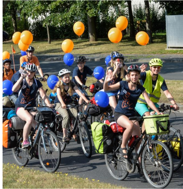
Fahrrad-Parade beim jufafe